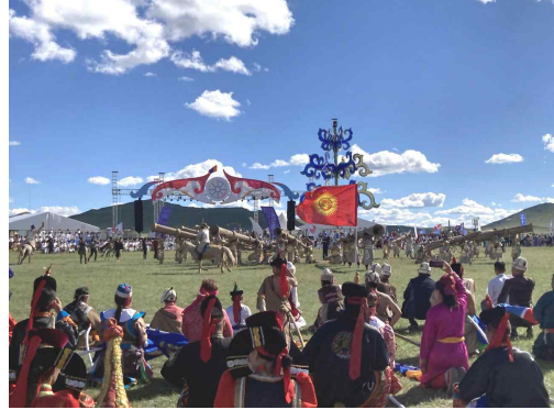
유목민 세계 문화 축제