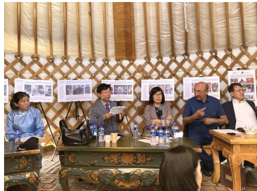
'무형유산의 미래 전략' 자문회의