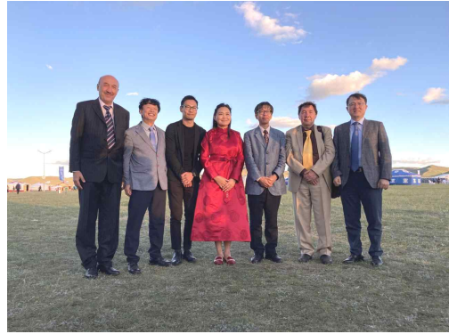
몽골 문화부 장관 면담