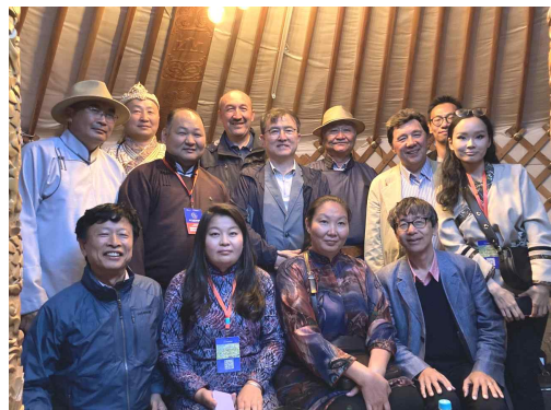
'유목 문화 보호' 선언문 채택 및 관계 기관 네트워킹